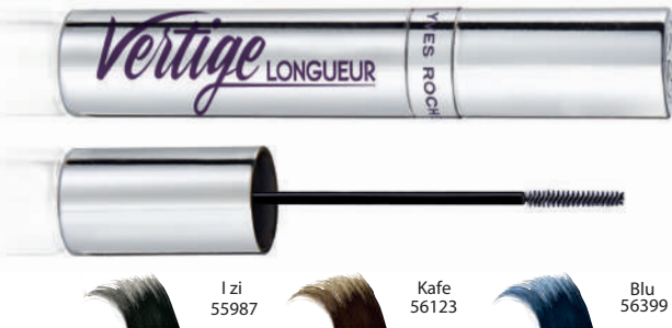
③ Maskara Vertige Longuer 8 ml - 2500 L