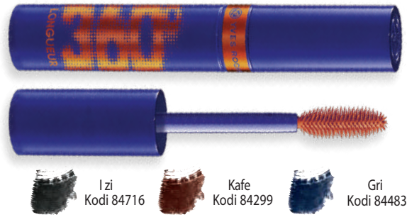
① Maskara për gjatësi, qerpikë 360° 8 ml - 1850 L