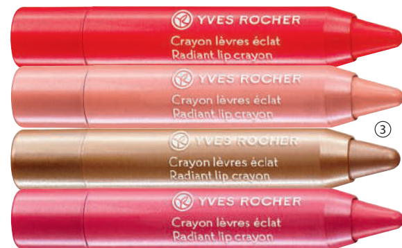
③ Laps shkëlqyes 2,5 g - 700L