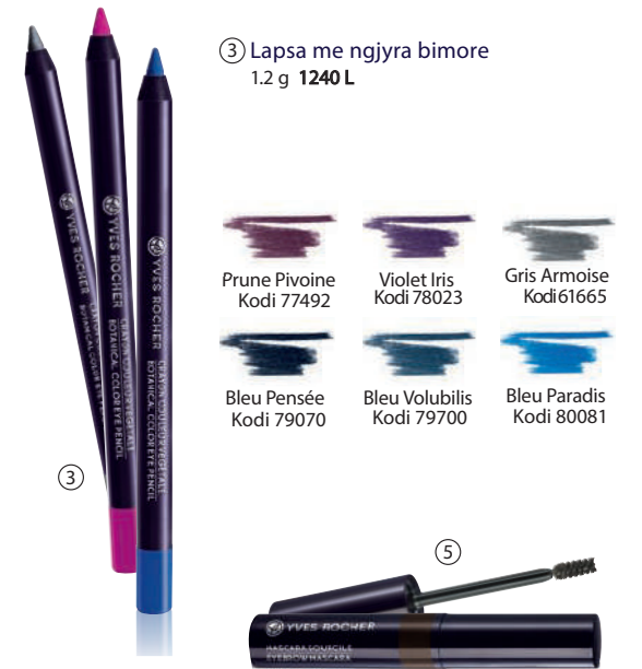
⑤ Maskara fiksuese 2.5 ml - 1300 L