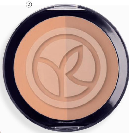
② Bronzer, 15 g - 2780L