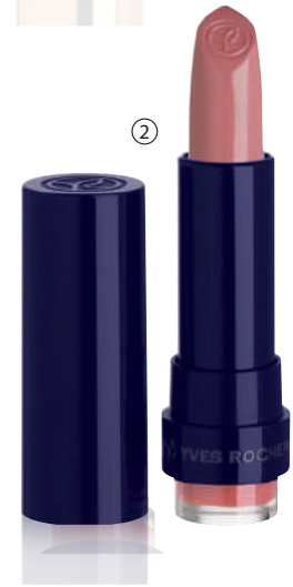
② BUZËKUQ VERTIGO, 3,7 g - 1400L