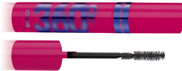
② Maskara për volum, qerpikë 360° 10 ml - 1690 L