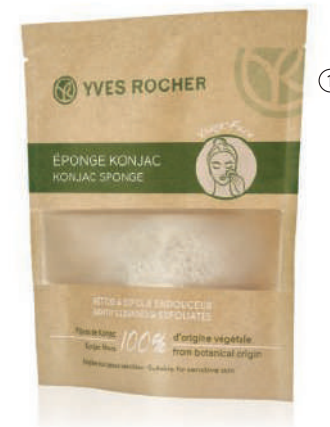
① Sfungjer me Konjak 1100 L