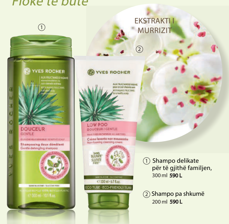
EKSTRAKTI I MURRIZIT