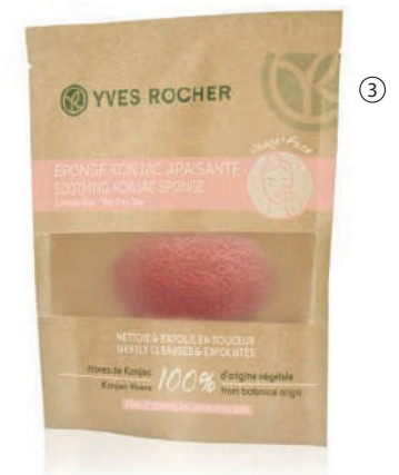
③ Sfungjer me Konjak Lëkurë e ndjeshme 1100 L