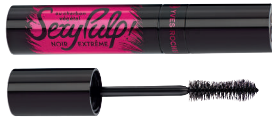
⑤ Maskara SEXY PULP 10 ml - 1950 L