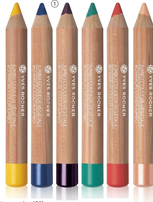
② Lapsa sysh - 450L