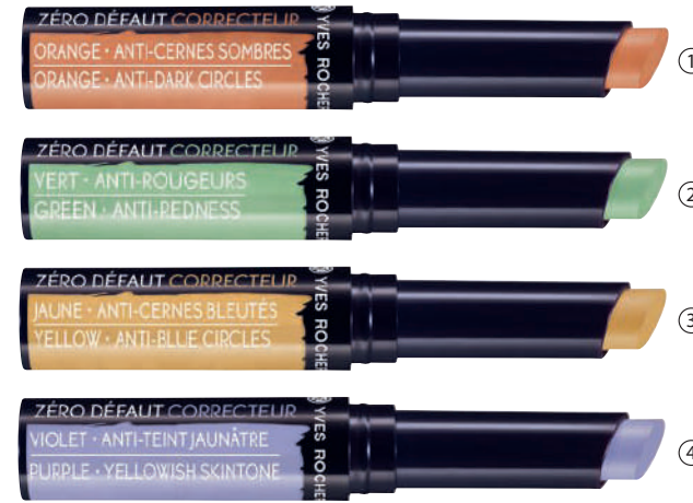
ZERO DEFAUT Korrektor me ngjyra 1.4 g - 990L

① Korrektor për rrathët e zinj kodi 41365