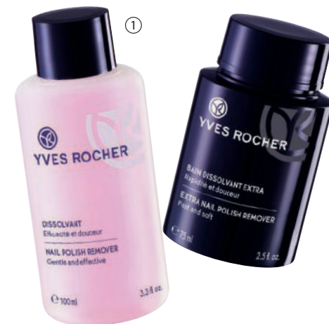
② Heqës manikyri, 75 ml bottle - 15708