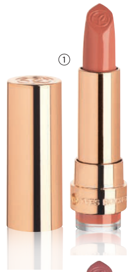
① GRAND ROUGE, 3,7 g - 1400L