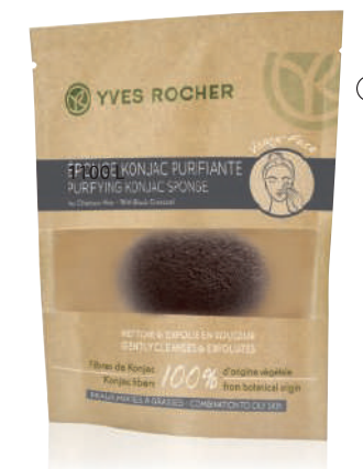
② Sfungjer me Konjak purifikues Lëkurë normale në mikse 1100 L