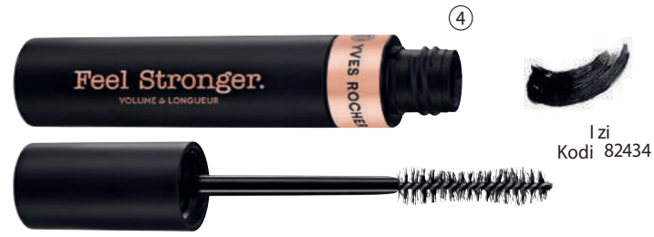
④ Maskara FEEL STRONGER, 10 ml - 1890 L