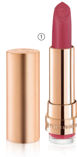
① GRAND ROUGE MAT, 3,7 g - 1490L