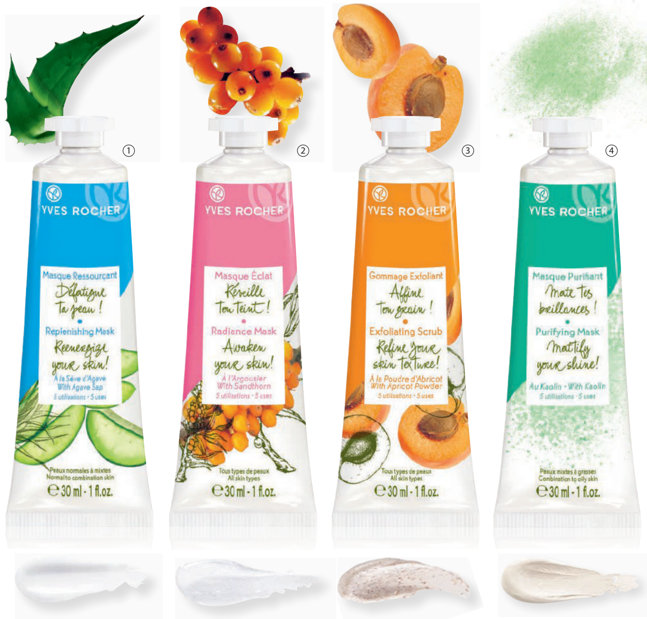
① Maskë hidratuese, 30 ml 690 L

Një skrab pas palestres, shkëlqim pas një dite me stres, rigjallërim i lëkurës pasi keni fjetur pak orë, purifikim i saj... Një lëkurë e bukur, pavarësisht kushteve, falë mini maskave me kosto të ulët, praktike dhe që plotësojnë çdo nevojë që ju keni. Formula e tyre është Vegan, dhe më shumë se 90% e përbërësve janë me origjinë bimore.