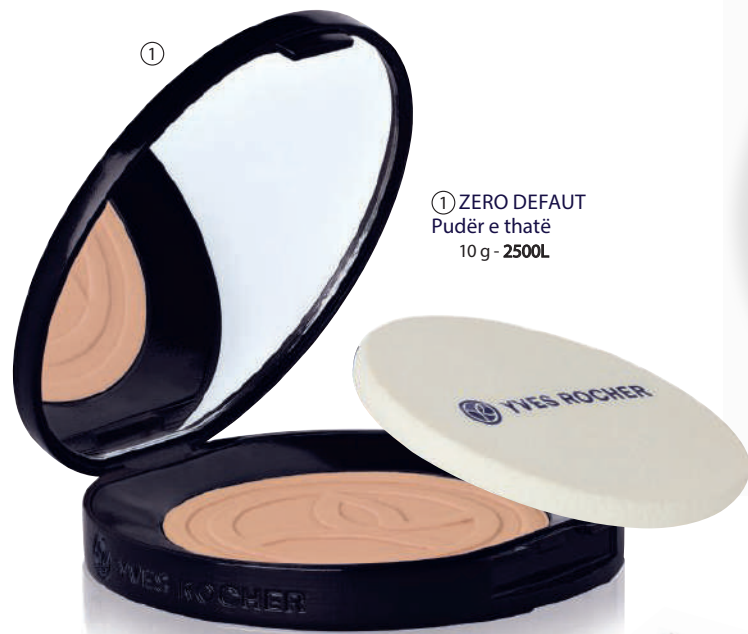
① ZERO DEFAUT Pudër e thatë 10 g - 2500L