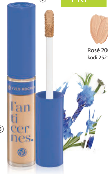
⑤ KORREKTOR ME MBULIM TË LARTË 7 ml - 1190L